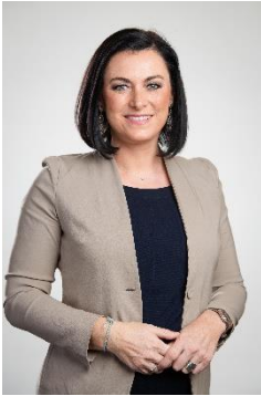
Elisabeth Köstinger Bundesministerin

Nachhaltige Waldbewirtschaftung und deren konsequente Umsetzung ist Grundlage unseres heutigen Waldreichtums in Österreich. Das Konzept Nachhaltigkeit wurde von Menschen entwickelt, die den Wald erhalten wollten. Es kann in Mitteleuropa auf eine 300-jährige Geschichte zurückblicken.